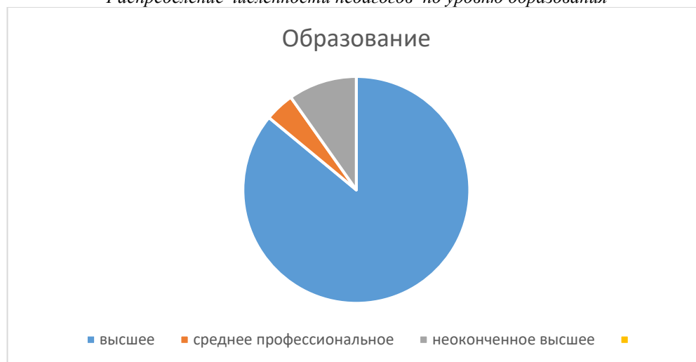
Распределение численности педагогов по уровню образования

Всего численность работников, имеющих высшее образование – 94 чел. (77% от общей численности). Из них имеют высшее образование – 89 чел. (73%).